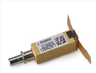
TOSA/ROSA for 40G/100G BASE-LR4 QSFP