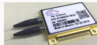
40G/100G Integrated Coherent Receivers