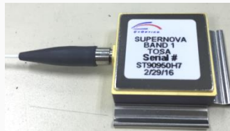
10x10G DWDM T/ROSA